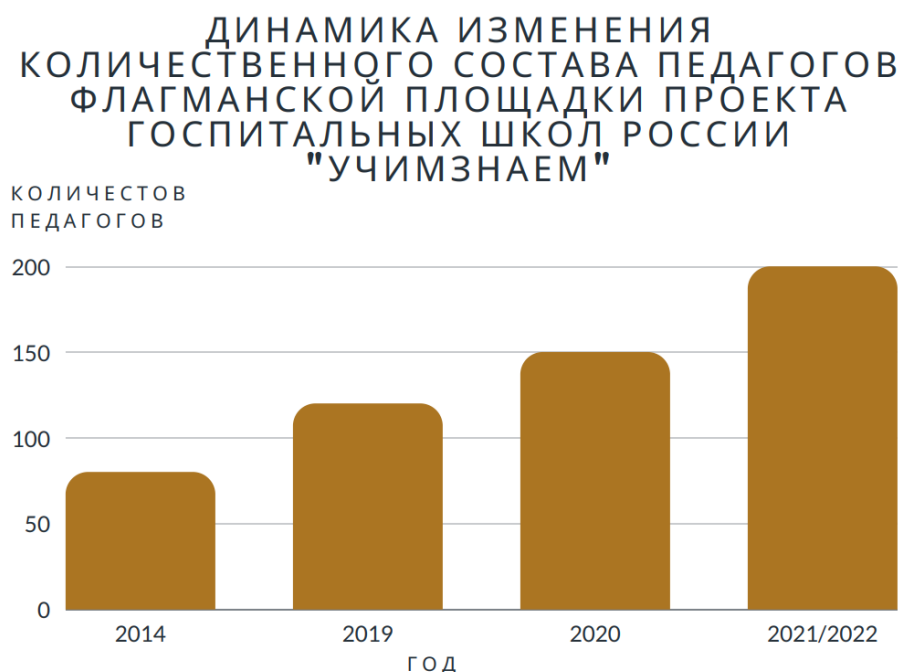
Рис. 1. Динамика изменения количественного состава педагогов флагманской площадки проекта госпитальных школ России «УчимЗнаем».

Сегодня в подразделениях флагманской площадки работает 200 педагогов. Они обеспечивают реализацию не только основных образовательных программ начального, основного и среднего общего образования, но и программ дошкольного образования, а также дополнительных общеобразовательных программ. В эту команду входят и учителя-дефектологи, тьюторы, которые работают с детьми с прогрессирующими заболеваниями и неопределенным прогнозом жизни в стационарах детского хосписа. Причем особенно стоит отметить, что сегодня в значительной степени коллектив представлен молодыми специалистами, которые не только видят большой потенциал для личностного и профессионального развития в рамках тематики госпитальной педагогики, но сами вносят большой вклад в развитие современной модели госпитальных школ.