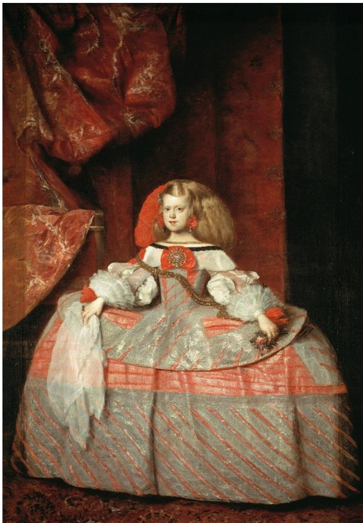
Портрет дочери короля Филиппа IV