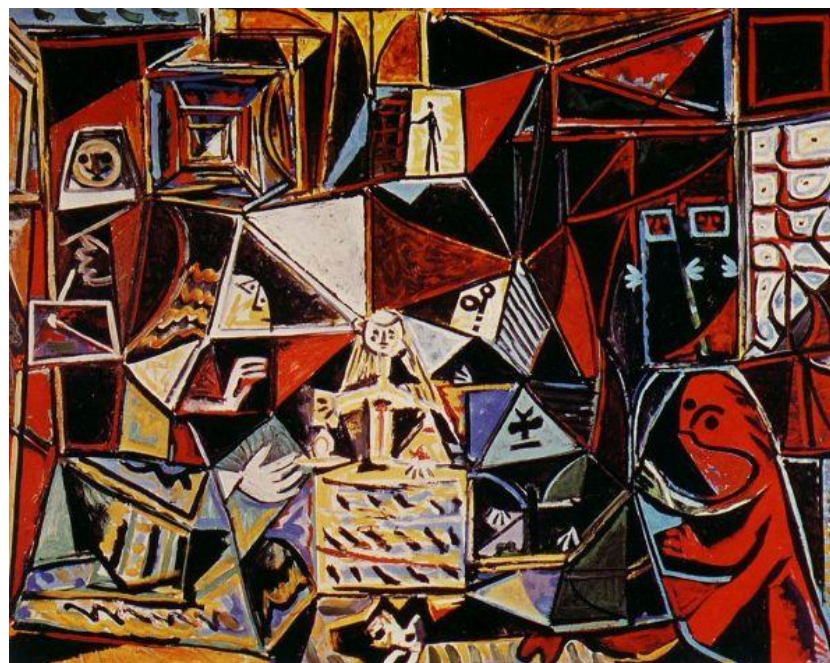
Пабло Пикассо "Менины. По Веласкесу" 1957.