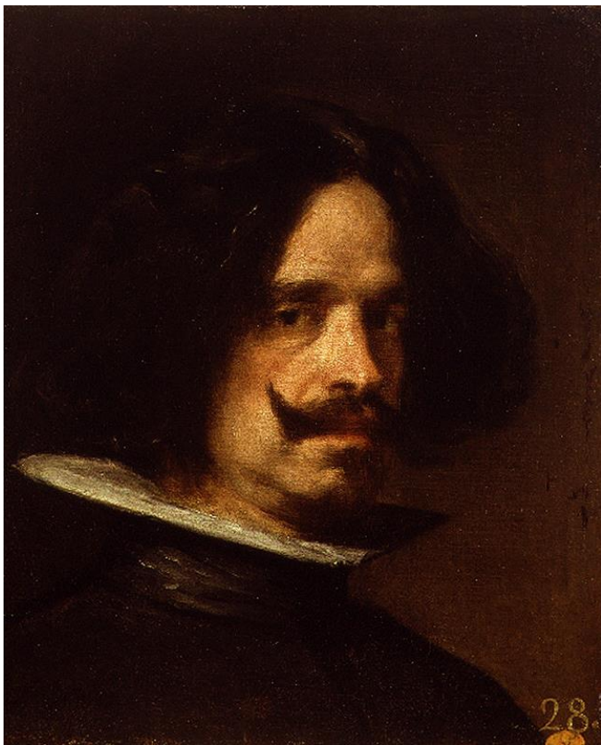
Автопортрет, 1640 Музей Изыщных искусств, Валенсия