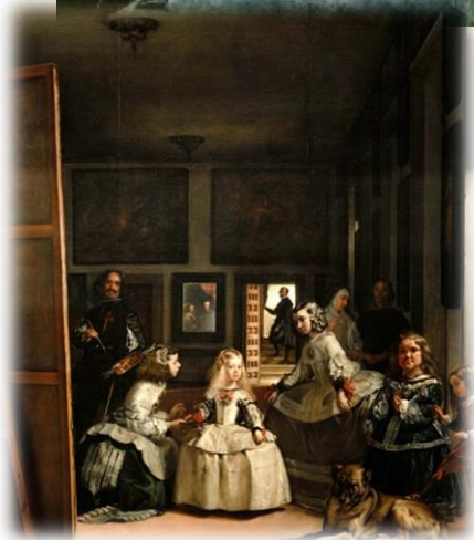
Диего Веласкес «Менины». 1656