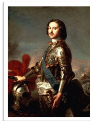
Молодой Петр I

Что мы помним об эпохе правления Петра I ?