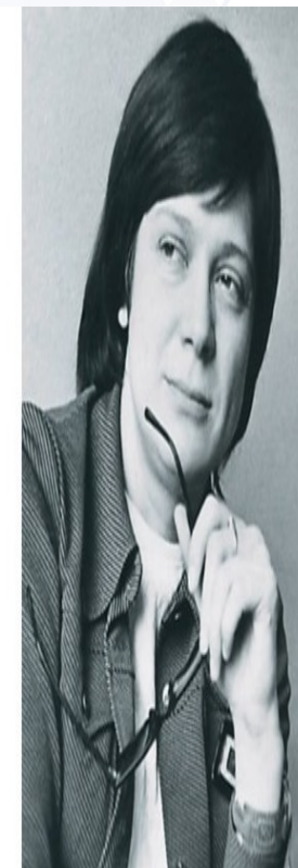
Валерия Сергеевна Мухина

В разные исторические периоды и на протяжении человеческого развития формируется структура самосознания, которая состоит из пяти звеньев.